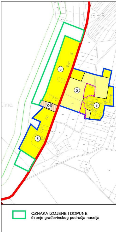
Prilog 1: Naselje Dazlina