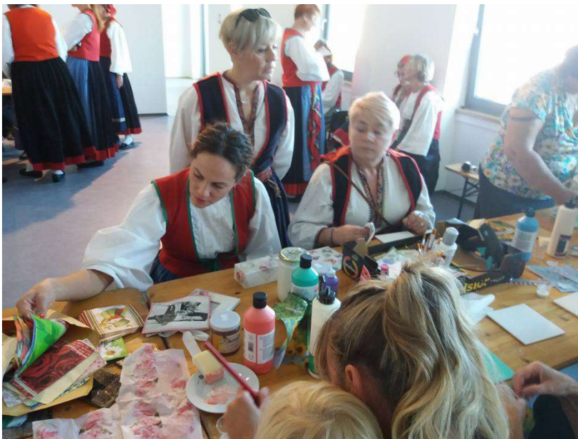
Kreativne radionice i tradicijski motivi