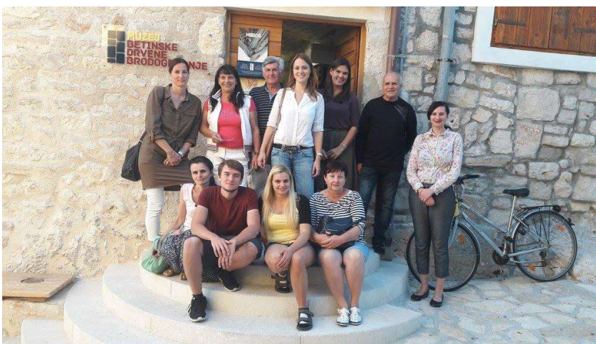
Posjeta muzeju drvene brodogradnje