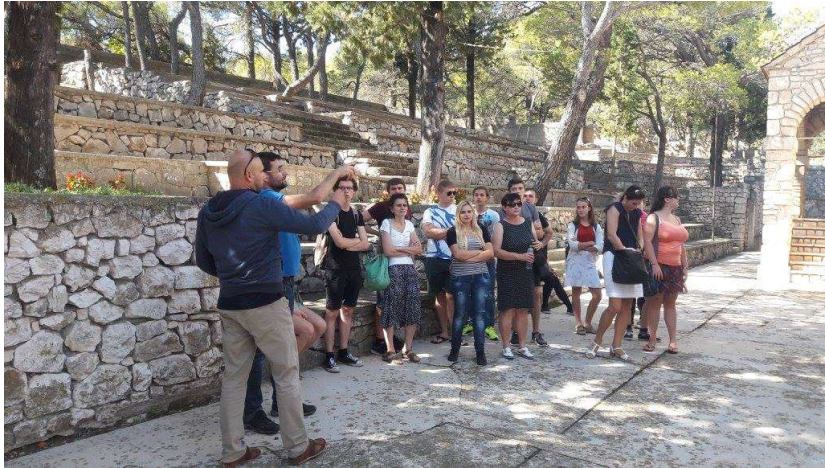
Obilazak kulturno-povijesnih lokaliteta