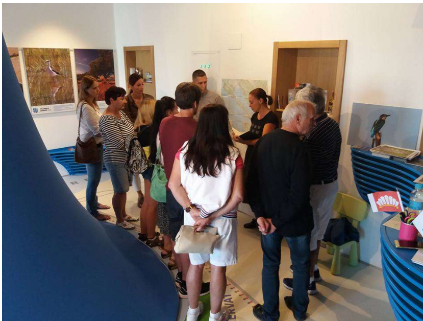
Upoznavanje sa prirodnim baštinama