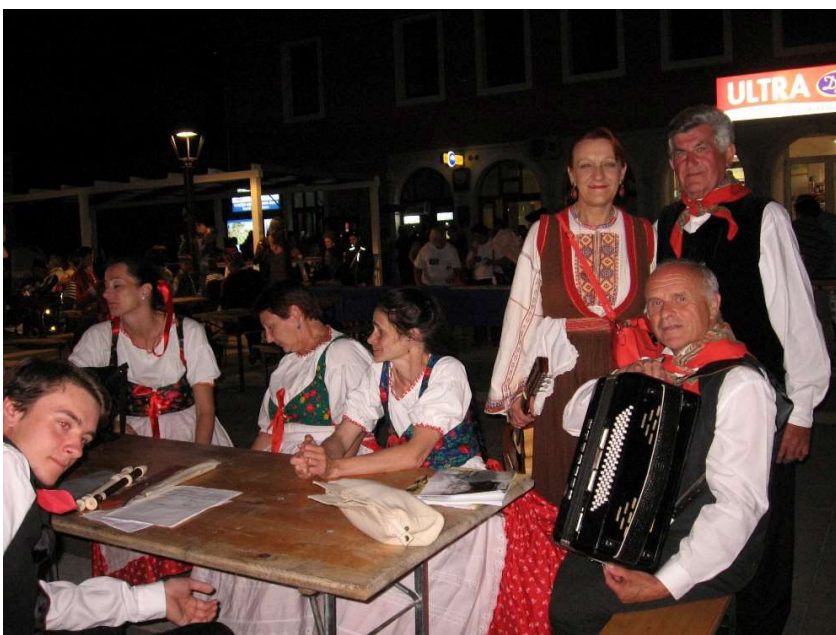
Prije nastupa na trgu u Jezerima