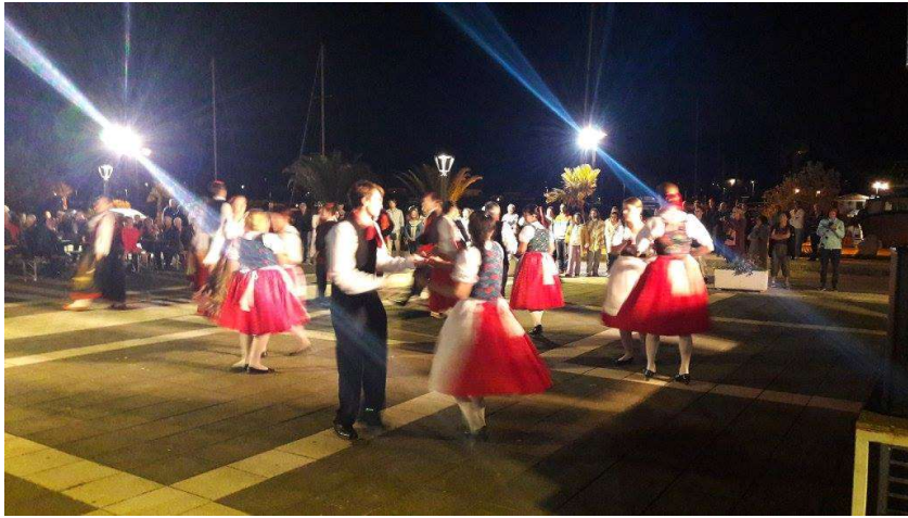
Zajednički nastup po završetku radionice