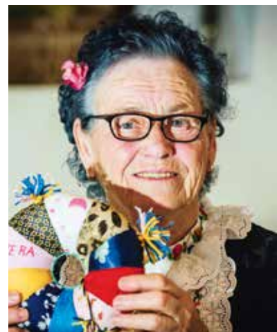
Spara je unikatni jezerski suvenir