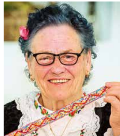
Staklene perlice za ogricu veličine su od jedan i pol do dva i pol milimetra

S ogrica smo prešli na spar, špar ili šparu. To su samo neki nazivi za krpeni "podmetač" namijenjen ženskoj glavi.