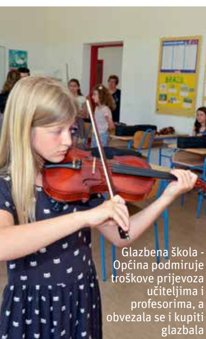
Glazbena škola - Općina podmiruje troškove prijevoza učiteljima i profesorima, a obvezala se i kupiti glazbala

Načelnik Klarin nije došao praznih ruku za nedavna posjeta svim trima prvim razredima na području tišnjanske općine. Zaželjivši im sretan početak nove školske godine i puno uspjeha u školovanju, mališanima je darovao školski pribor i slatkiše. Darivanje prvašića u Tisnome je tradicija. U ovoj školskoj godini, inače, u prve razrede upisana su ukupno 24 učenika, od kojih je u OŠ 'Murterski školji' – područnoj školi u Betini pet učenika, u OŠ 'Vjekoslav Kaleb' u Tisnome 11 učenika, dok je 8 prvašića upisano u područnu školu u Jezerima. Općina Tisno je na zahtjev OŠ 'Murterski školji' područnoj školi u Betini donirala informatičku opremu za opremanje jedne učionice, a sve radi poboljšanja kvalitete izvođenja nastave i omogućavanja da učenici lakše i bolje usvajaju gradivo te da se osuvremene uvjeti školovanja.