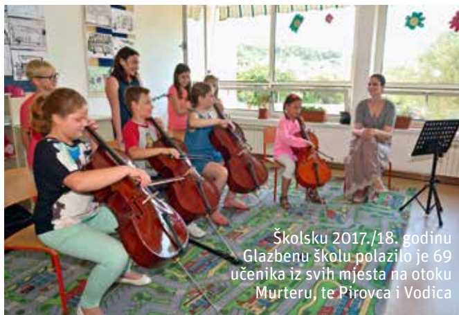
Školsku 2017./18. godinu Glazbenu školu polazilo je 69 učenika iz svih mjesta na otoku Murteru, te Pirovca i Vodica

Nova školska zgrada i uvjeti koje ima omogućila je još jednu dodanu vrijednost, a to je osnivanje Glazbene škole za koju je inicijativu pokrenuo Ivan Klarin, načelnik Općine Tisno. Škola je počela s radom u listopadu 2013. i te prve godine bilo je upisano 26 učenika da bi školsku 2017./18. godinu školu polazilo 69 učenika iz svih mjesta na otoku Murteru, te Pirovca i Vodica.