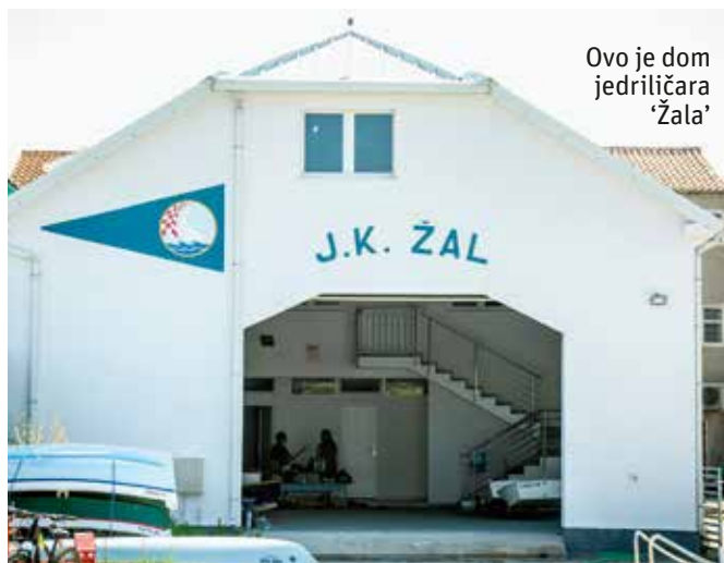
Ovo je dom jedriličara 'Žala'

ti, a posebno kad se, kad nema vjetra namjerno privrnem - kazao je simpatični Danijel Rafael Šikić. Kao i većina njegovih prijatelja iz kluba, prošlog je tjedna sudjelovao na 43. betinskoj regati u klasi Optimist, ali se reče - ne može pohvaliti nekim dobrim rezultatom. A i brodova je na regati bilo puno, 43 Optimista i pet Lasera, pa nije bilo lako stići među prvima. - Ma važno je sudjelovati. Ima vremena pred tobom do boljeg rezultata, zar ne? A je li bilo zabavno?