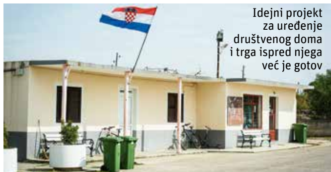
Idejni projekt za uređenje društvenog doma i trga ispred njega već je gotov