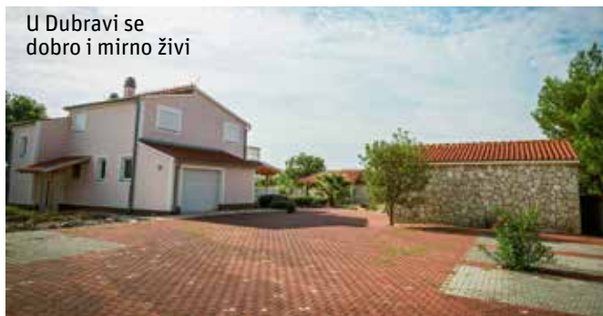
U Dubravi se dobro i mirno živi