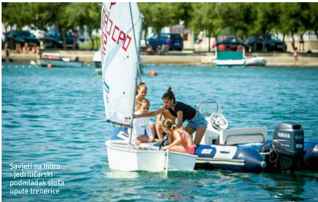
Savjeti na moru - jedriličarski podmladak sluša upute trenerice