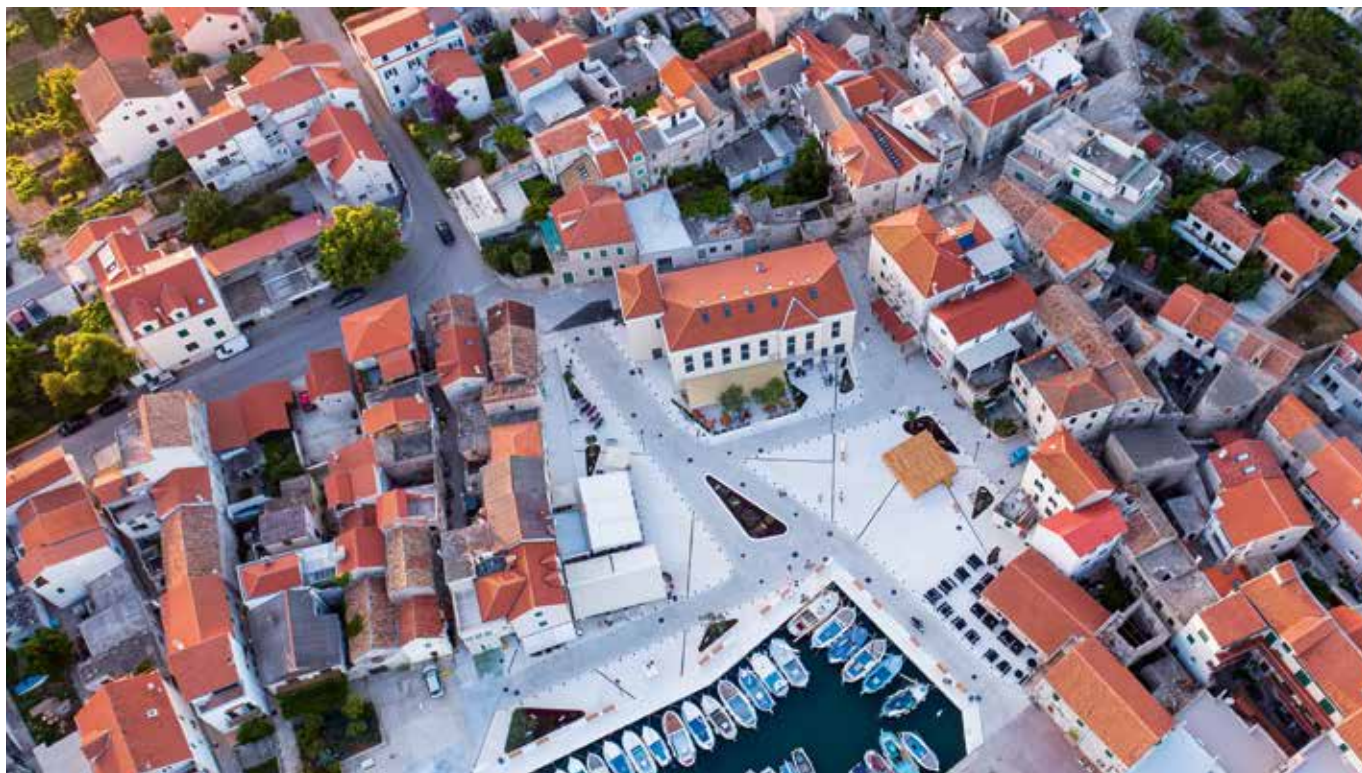
Ovako bi trebao izgledati Muzej betinske drvene brodogradnje izvan zidova