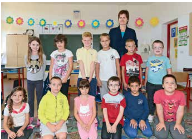
Ovo je snimljeno 2016. Danas su su ovo trećašići